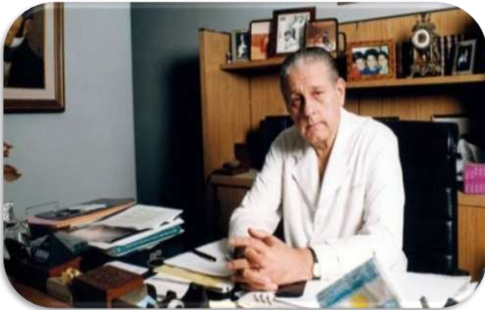
Favaloro en su despacho de la Fundación que lleva su nombre.

Alguna vez, el reportero del New York Times Eric Nagourney describió así el procedimiento: “Después de detener el corazón, el doctor Favaloro tomó una sección de la vena de la pierna del paciente y le cosió un extremo a la aorta. Luego, de la misma manera en que un conductor podría usar un camino lateral para rodear un atasco de tráfico, conectó el otro extremo a la arteria bloqueada, más allá del bloqueo” (The New York Times, 1° de agosto de 2000.)