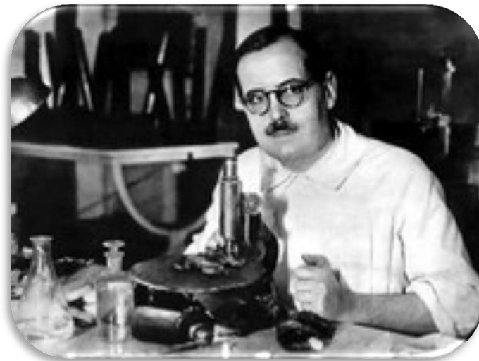
Dr. Bernardo Houssay (1887-1971)

Para esta fecha se eligió el día del nacimiento del doctor Bernardo Houssay (1887-1971), eminente científico argentino cuya trayectoria marcó un punto de inflexión en el desarrollo de la ciencia en el país.